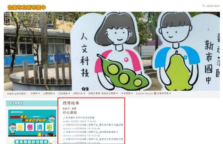
說明：力字數位學習平台推廣