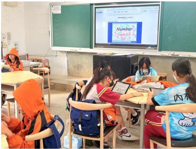
說明：因材網星空圖