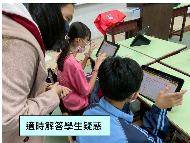
適時解答學生疑惑