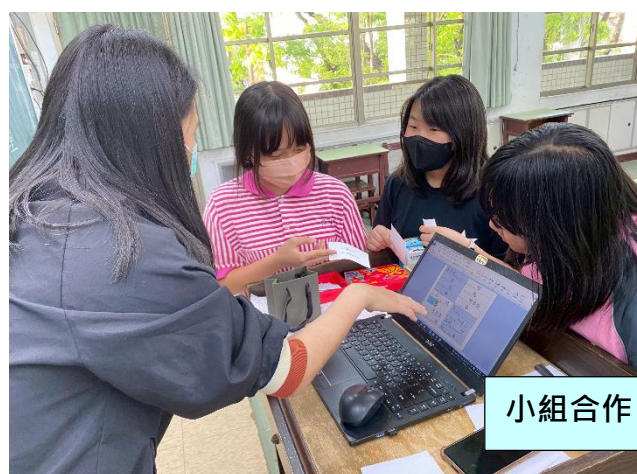
小組合作、攻擊對手