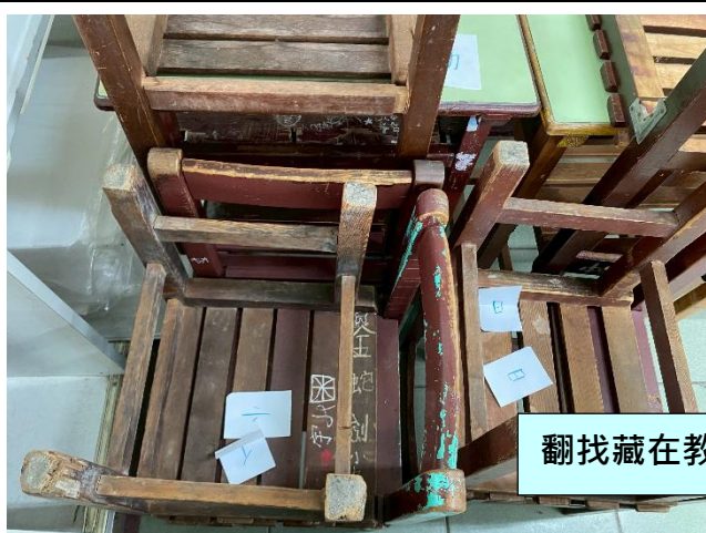
翻找藏在教室各處的字卡