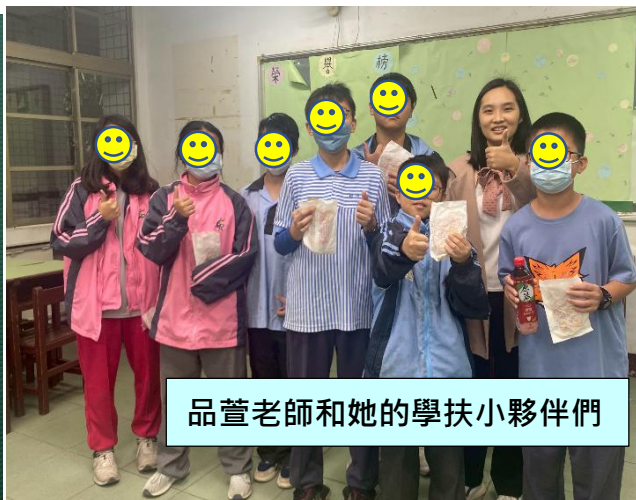
品萱老師和她的學扶小夥伴們